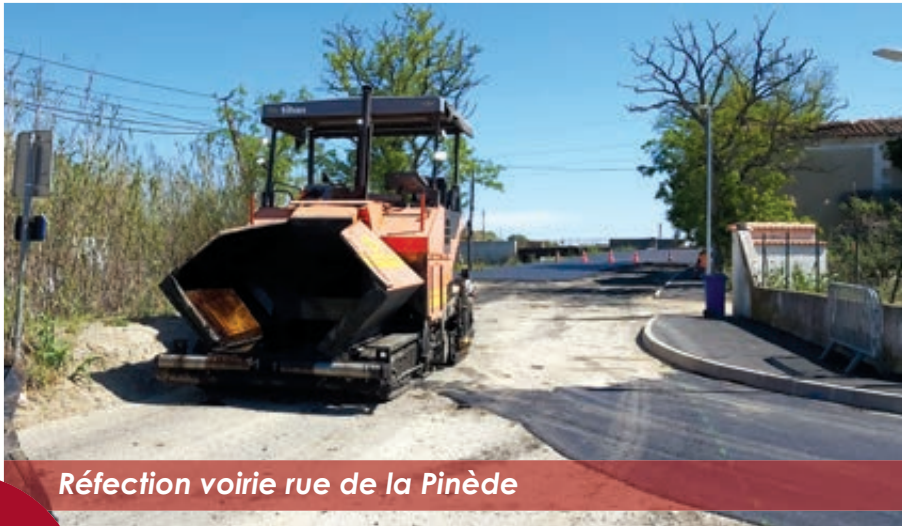
Réfection voirie rue de la Pinède