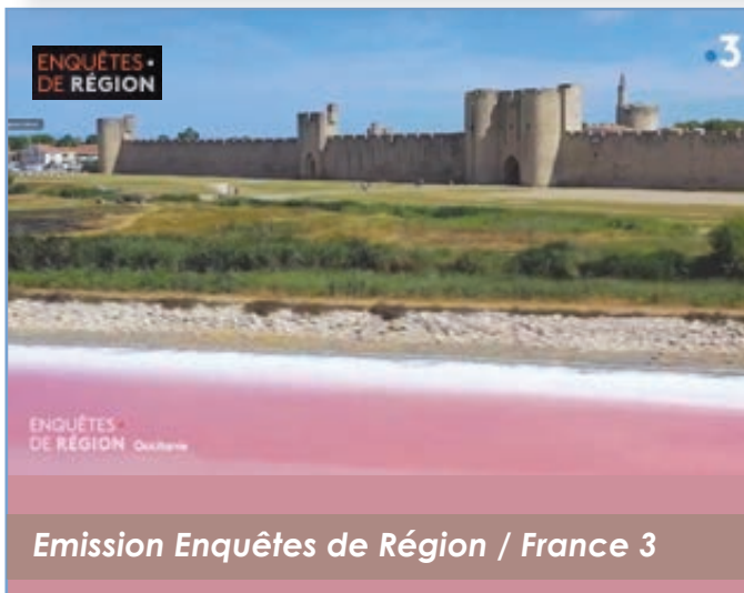
Emission Enquêtes de Région / France 3