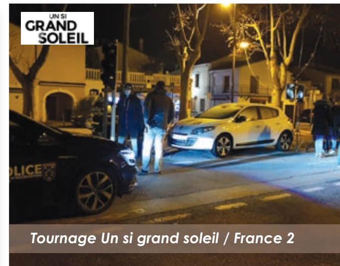
Tournage Un si grand soleil / France 2