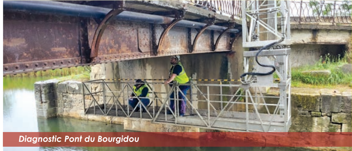
Diagnostic Pont du Bourgidou