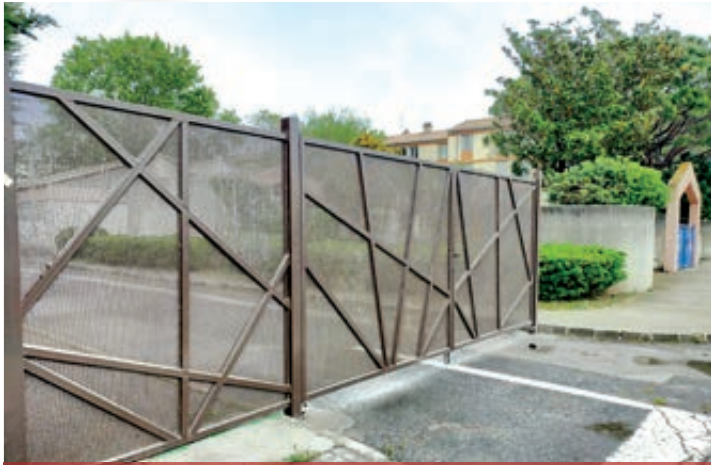
Portail Crèche Halte-Garderie Gavroche