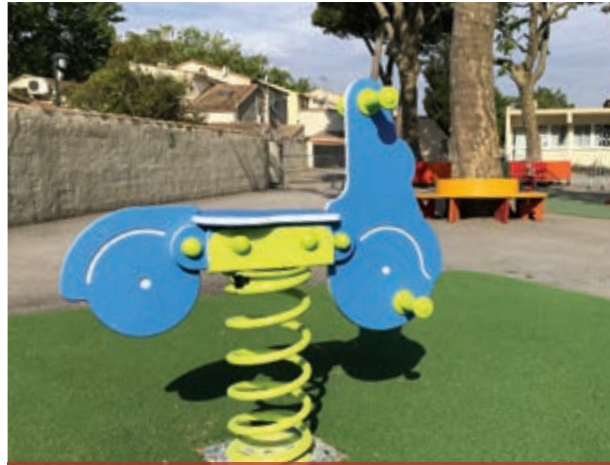
Nouveaux jeux école maternelle