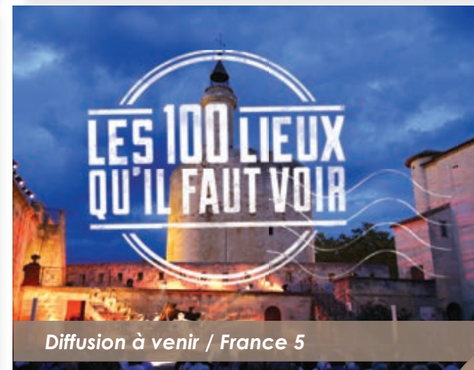
Diffusion à venir / France 5