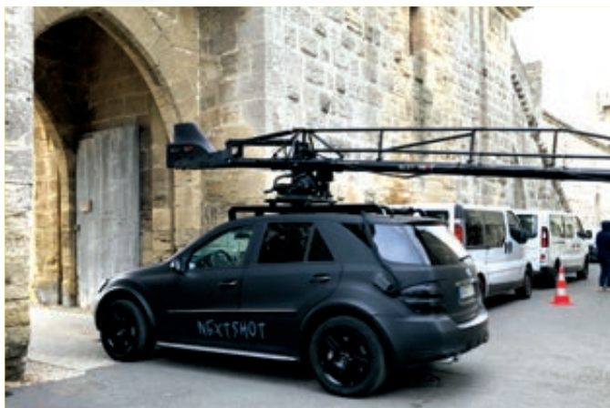
Tournage publicitaire Citroën