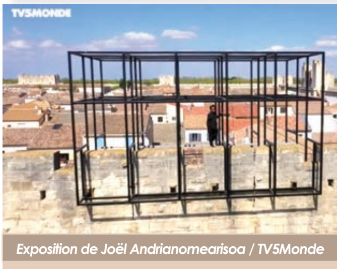
Exposition de Joël Andrianomearisoa