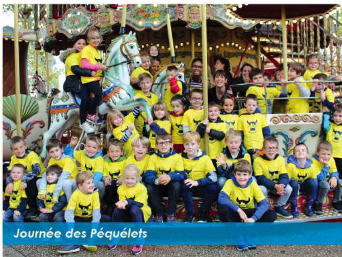
Journée des Péquétets