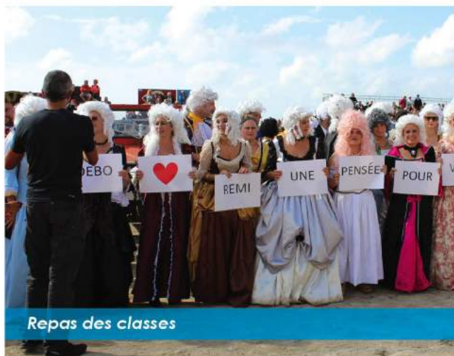
Repas des classes