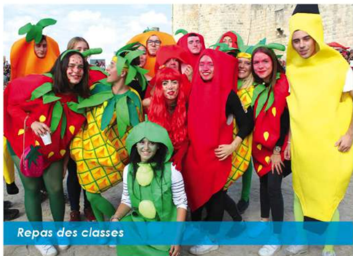
Repas des classes