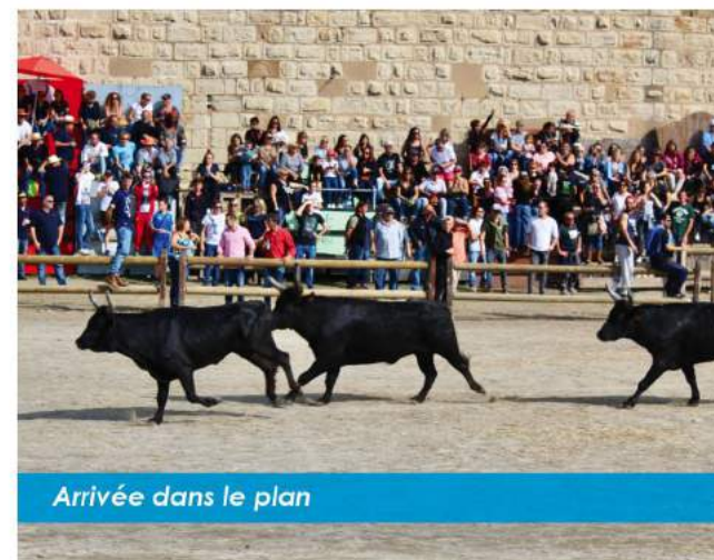
Arrivée dans le plan