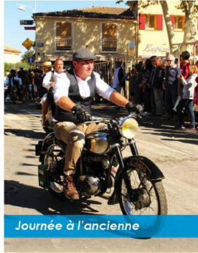
Journée à l'ancienne