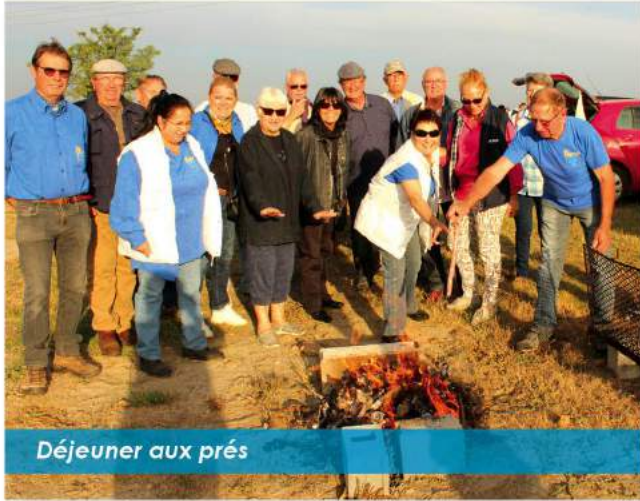
Déjeuner aux prés