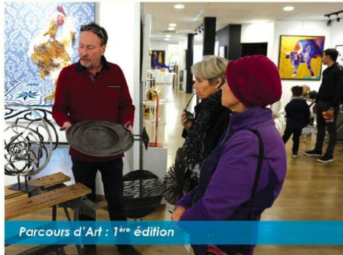
Parcours d'Art : 1 ère édition