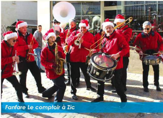
Fanfare Le comptoir à Zic