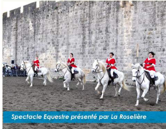
Spectacle Equestre présenté par La Roselière