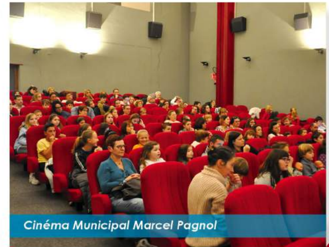
Cinéma Municipal Marcel Pagnol