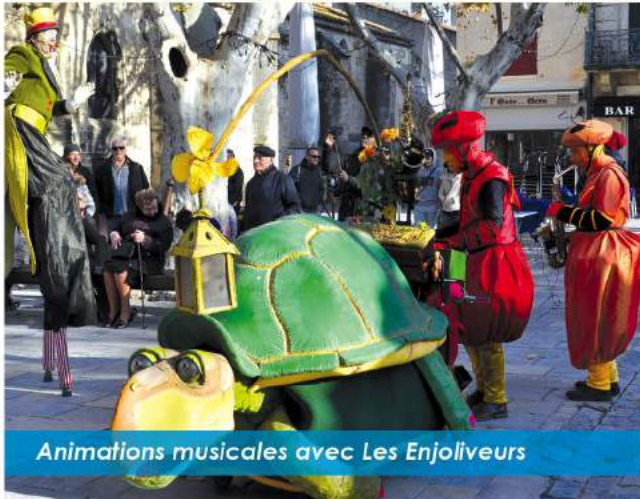
Animations musicales avec Les Enjoliveurs