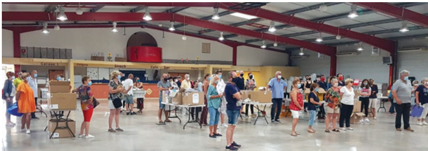
Bénévoles : distribution de masques dans les boîtes aux lettres