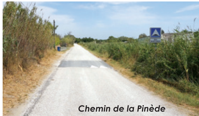
Chemin de la Pinède