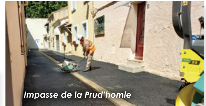
Impasse de la Prud'homie