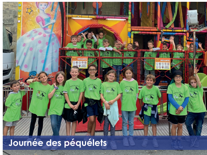
Journée des péquétets