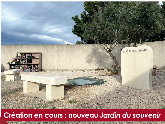
Création en cours : nouveau Jardin du souvenir