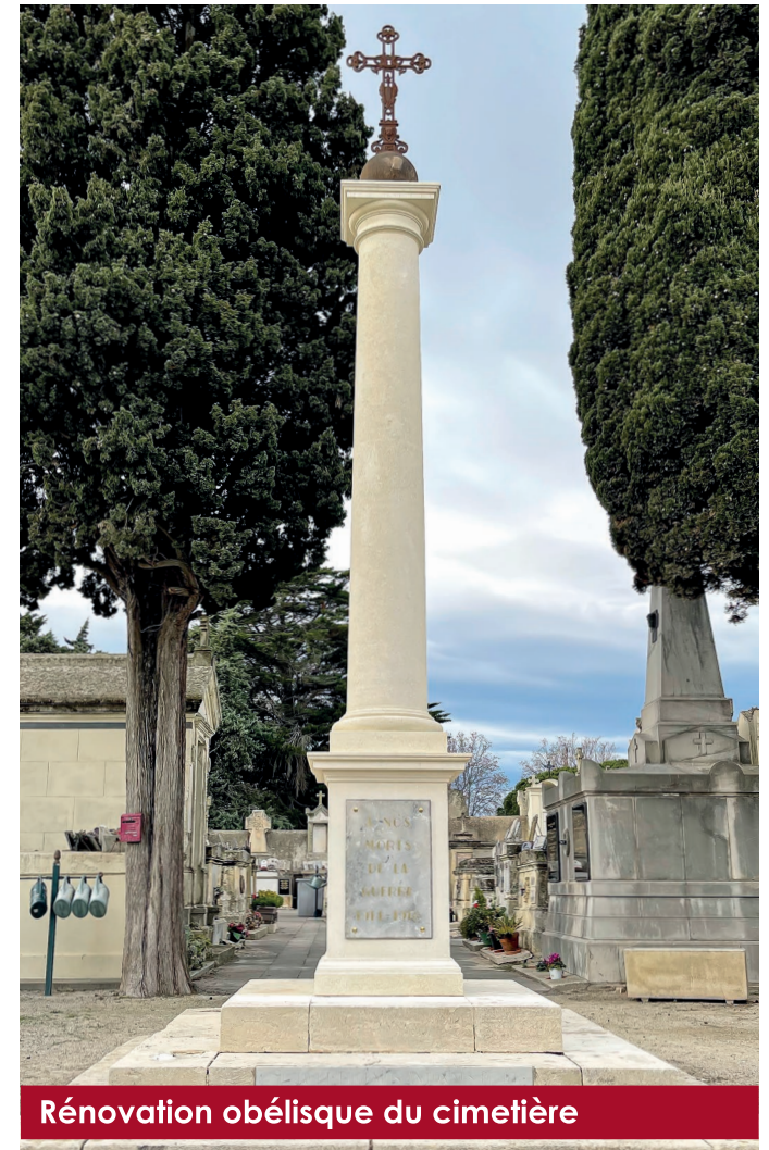
Rénovation obélisque du cimetière