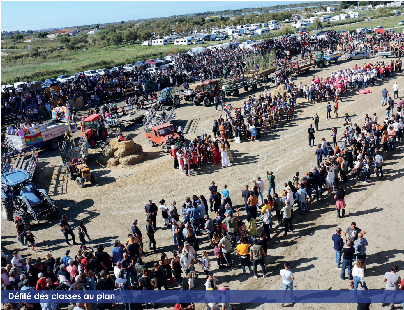
Défilé des classes au plan