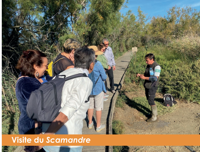
Visite du Scamandre