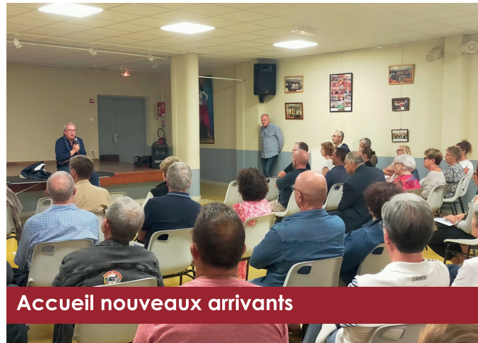
Accueil nouveaux arrivants