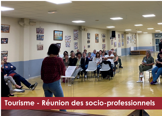
Tourisme - Réunion des socio-professionnels