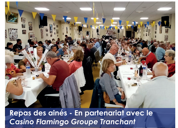
Repas des aînés - En partenariat avec le Casino Flamingo Groupe Tranchant