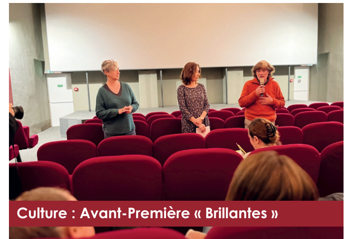
Culture : Avant-Première « Brillantes »