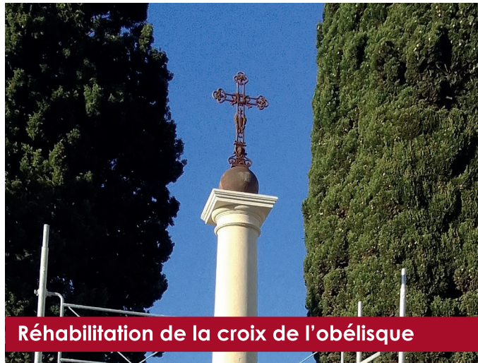
Réhabilitation de la croix de l'obélisque