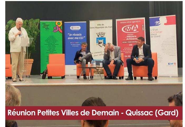
Réunion Petites Villes de Demain - Quissac (Gard)