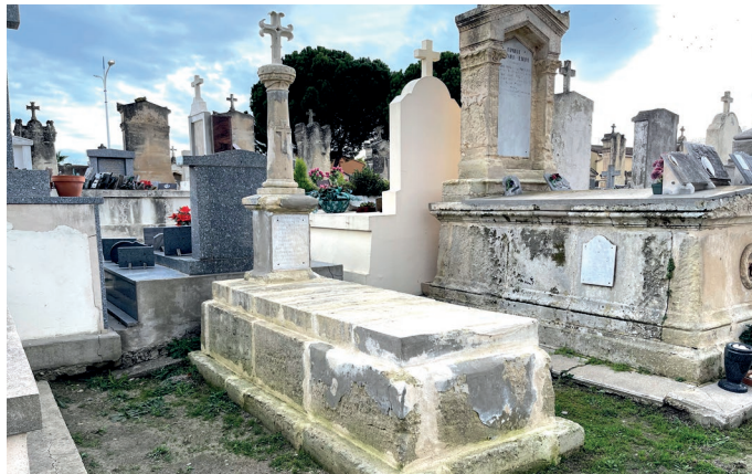
Entretien : tombe de Noël Arnassant, bienfaiteur Aigues-Mortais