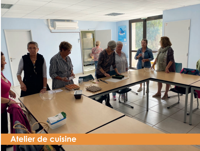
Atelier de cuisine