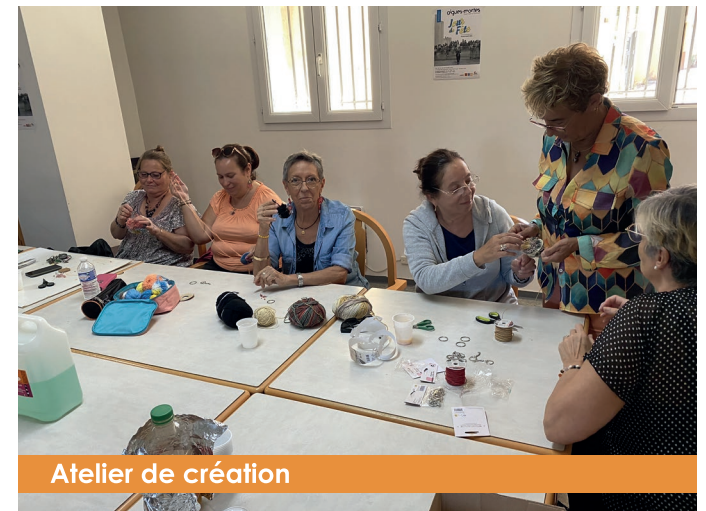
Atelier de création