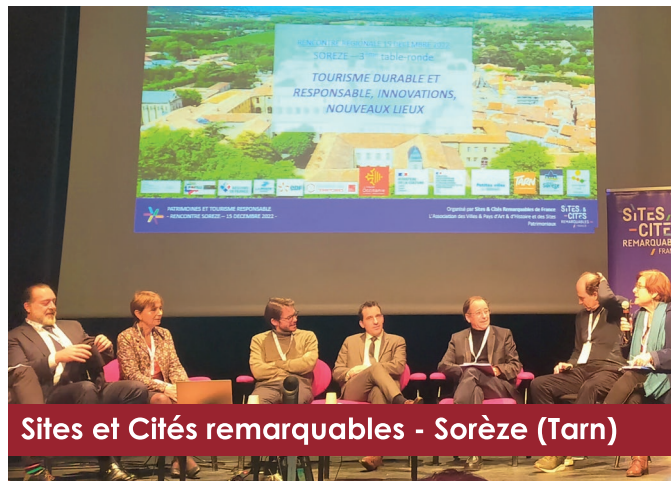
Sites et Cités remarquables - Sorèze (Tarn)