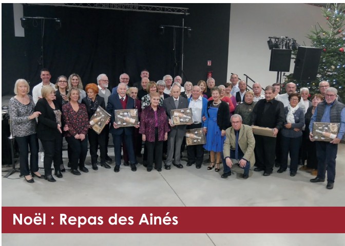
Noël : Repas des Aînés