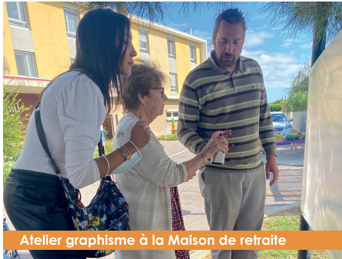
Atelier graphisme à la Maison de retraite