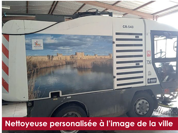
Nettoyeuse personnalisée à l'image de la ville