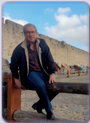
Pierre Mauméjean Maire d'Aigues-Mortes