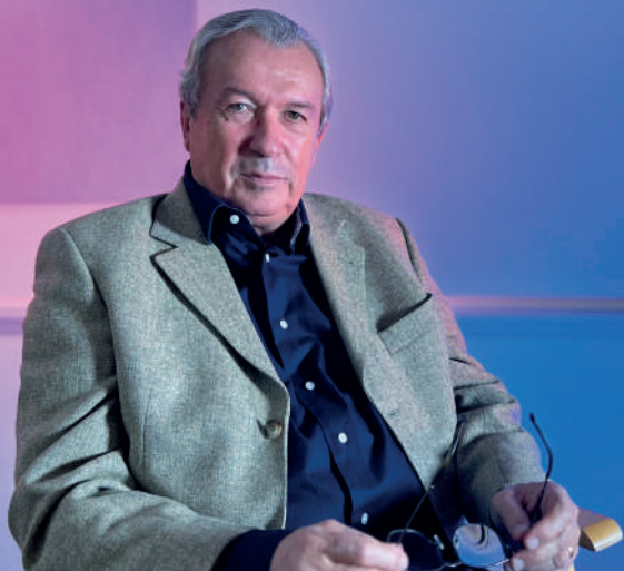
Pierre Mauméjean Maire d'Aigues-Mortes