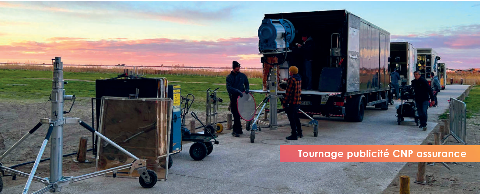
Tournage publicité CNP assurance