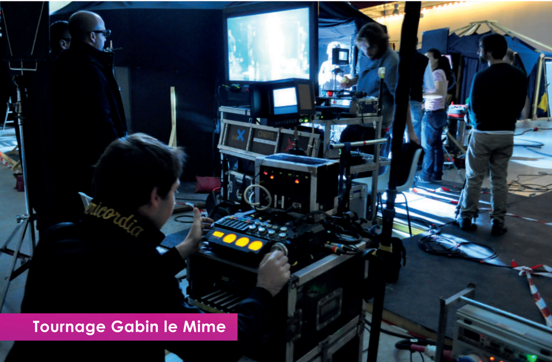
Tournage Gabin le Mime